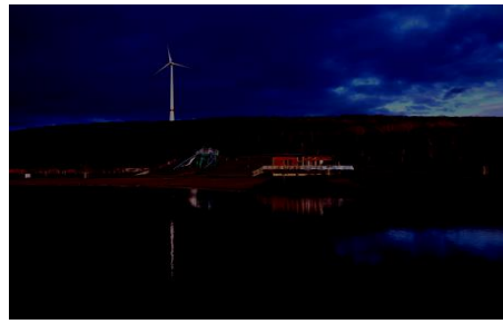
Halde Lohberg Nord