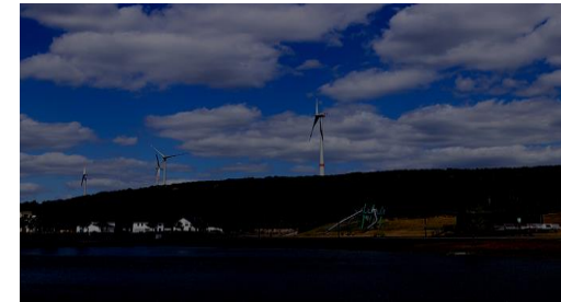
Halde Lohberg Nord Erweiterung Standort: Hünxe